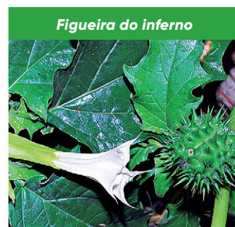
Figueira do inferno