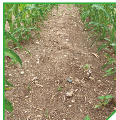
Ref: Tembotriona OD 2,25 l/ha