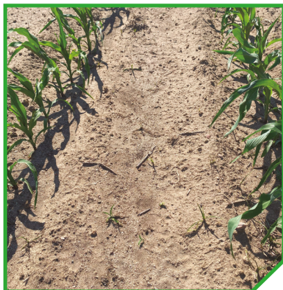
Arigo® 330 g/ha + Dragster® 67,5 g/ha + Vivolt® 0,2% v/v