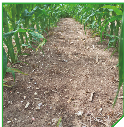
Arigo® 330 g/ha + Dragster® 67,5 g/ha + Vivolt® 0,2% v/v