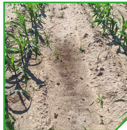
Ref: Tembotriona OD 2,25 l/ha