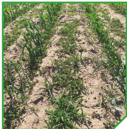
Parcela sem tratamento