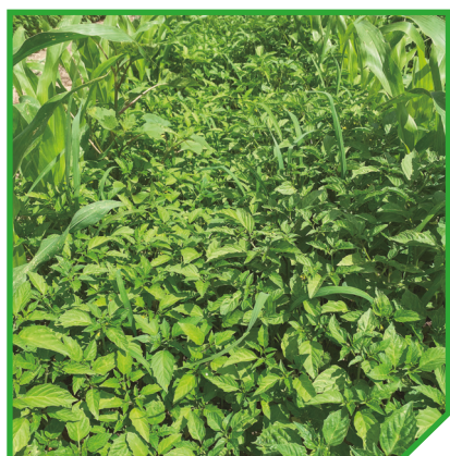
Parcela sem tratamento