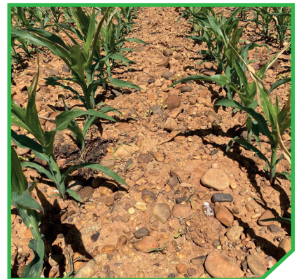
Nicossulfurão (60 g s.a./ha) + Emir® 0,3 l/ha + Vivolt® 0,2% v/v