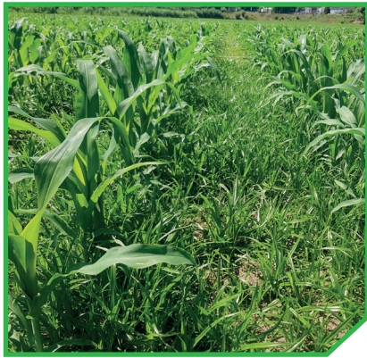
Testemunha: Cyperus spp.