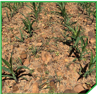
Emir® 0,3 l/ha + Vivolt® 0,2% v/v