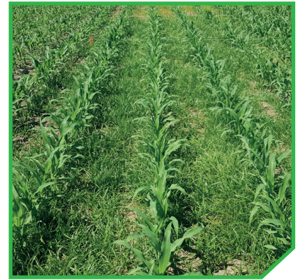
Ref: Mesotriona + Nicossulfurão + Bentazona