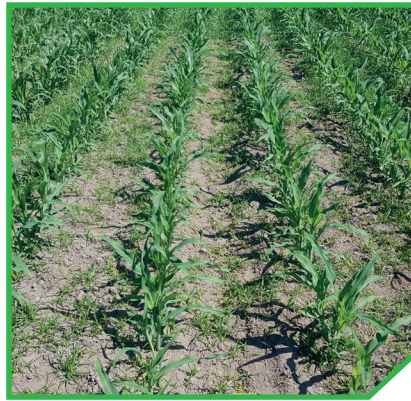
Arigo® 330 g/ha + Emir® 0,3 l/ha + Vivolt® 0,2% v/v